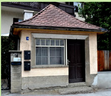
Eine der vielen früheren Nahversorger, Sternwartestraße 16, heute steht es leer.