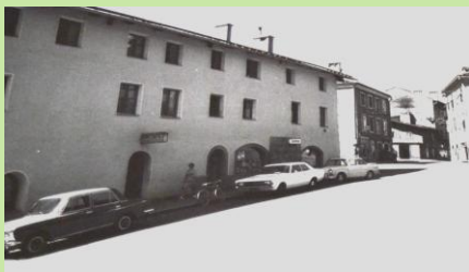
Café Höhenstraße, Höttinger G. 32, heute "Werk statt Couch"